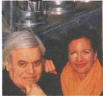
Ein richtig lieber Kerl, der Giger. Und lachen tut er auch gern!

GREYERZ FR - Er hat einen Oscar, aber arbeitet trotzdem wie ein Besessener: H.R. Giger (62). Eine Begegnung mit dem berühmten Künstler.