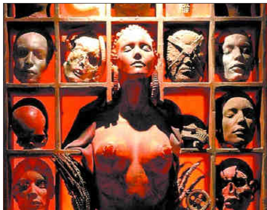
Dos obras relacionadas con la película Species : una instalación y, a la derecha, escultura a tamaño real de la criatura del largometraje de 1995. R. C. C.