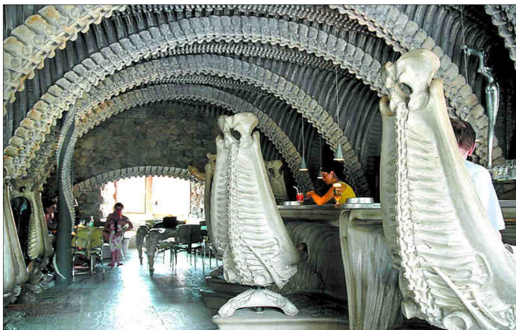
El Giger Bar ha sido diseñado hasta el último detalle por el artista suizo, incluyendo el suelo tallado con jeroglíficos, los techos de vértebras y costillas, y las sillas. RODRIGO CARRIZO COUTO

El museo alberga, organizada de manera cronológica, la obra de un creador cuya primera exposición individual data de 1966.