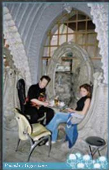
Pohoda v Giger-bare.

Giger-múzeum Gruyères Giger-bar Gruyères Landesgalerie Linz