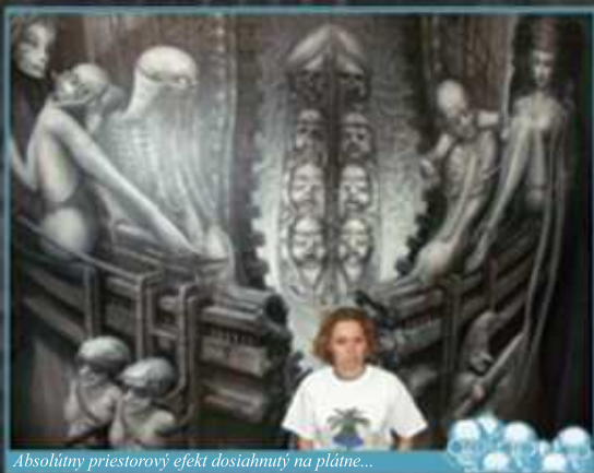
Absolútny priestorový efekt dosiahnutý na plátne...