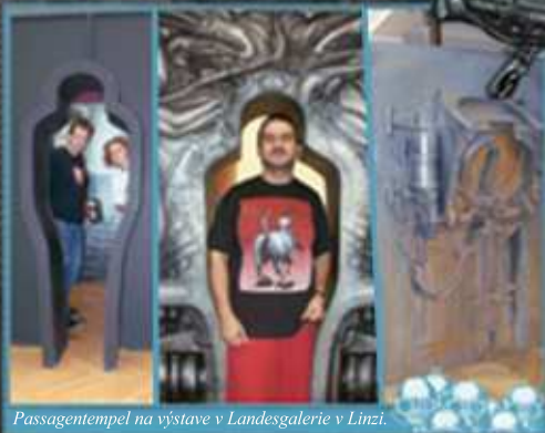
Passagentempel na výstave v Landesgalerie v Linzi.