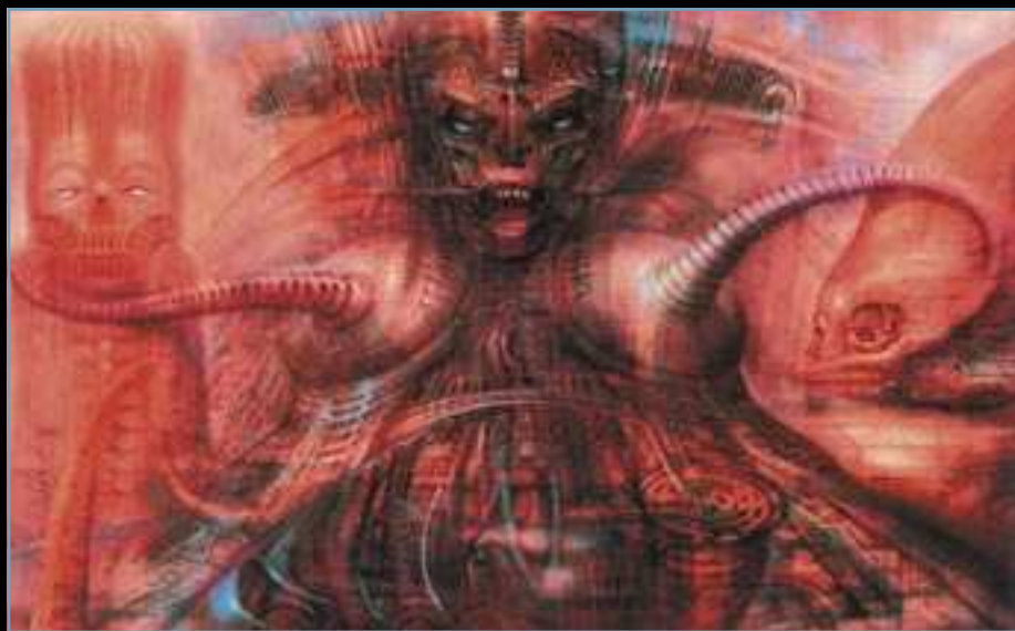
H. R. Giger: Victory V. (Satan)