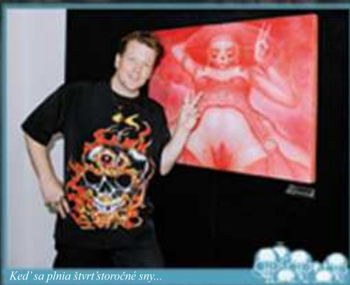
Keď sa plnia štvrt'storočné sny...