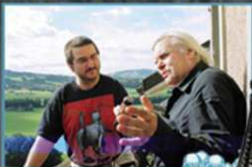
Z rozhovoru na balkóne mizea...