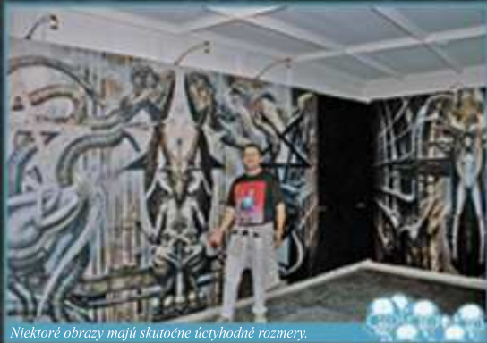
Niektoré obrazy majú skutočne úctyhodné rozmery.