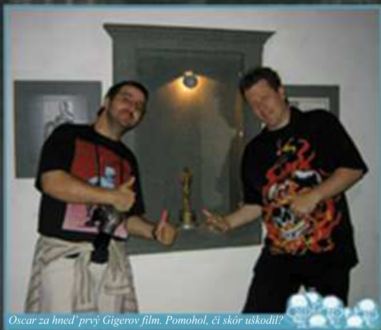
Oscar za hneď prvý Gigerov film. Pomohol, či skôr uškodil?