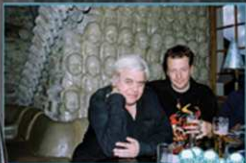
...sa neskôr stala neviazaná debata v Giger-bare...