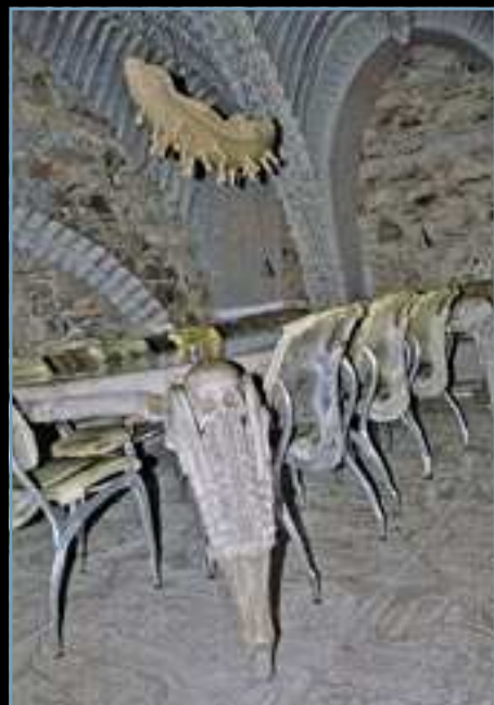
Záver z Giger - baru v Gruyères.

Bar v Gruyères je vlastne predĺženie môjho múzea. Je to vlastne úžitkové umenie v pravom zmysle slova. Tam si môžete posediť v mojich harkonnenských stoličkách. Tie boli pôvodne plánované do filmu Duna, ktorý som mal robiť s režisérom Alessandrom Jodorowským, ale projekt sa neuskutočnil a nakoniec to natočil David Lynch. V mojom rodisku, mestečku Chur, som pre jedného architekta robil bar. Nič som za to nežiadal, len odlievacie formy. A tu dole v Gruyères som chcel spraviť niečo, čo by vyzeralo starobylo. Niečo, čo vyzerá, že tu je už veľmi dlho. Žiadne moderné materiály, radšej kameň. A trochu skla na stoly a hliníka na stoličky. Zvyšok je z betónu, stoličky a lavice... Oblúky na strope však nie sú z betónu, boli by veľmi ťažké a múry by ich neunesli. Tak som ich dal spraviť z polyestere. Oblúky sme zavesili do výšky štyroch metrov. Chcel som, aby to malo v sebe niečo sakrálné, ako