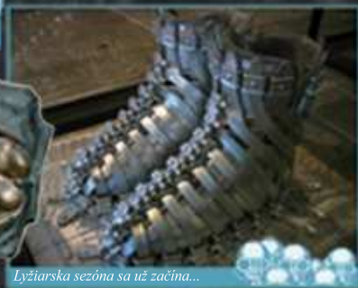
Lyžiarska sezóna sa už začína...