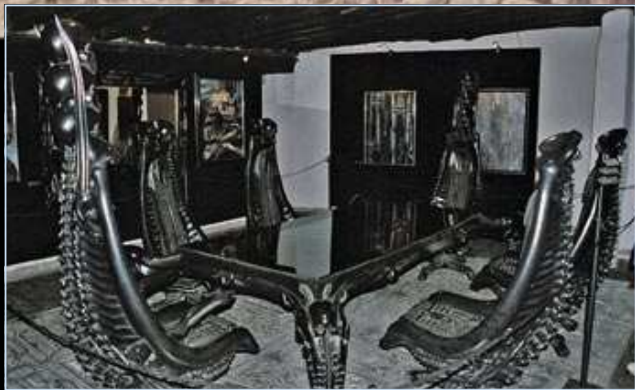
Harkonnenovské stoličky, pôvodne navrhované pre film Duna, neskôr poslúžili v Giger - bare.