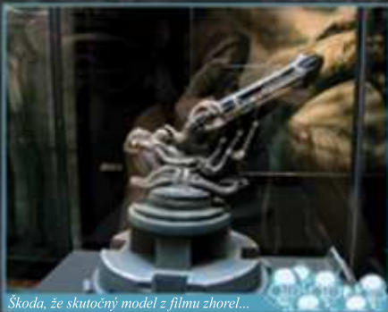
Škoda, že skutočný model z filmu zhorel...