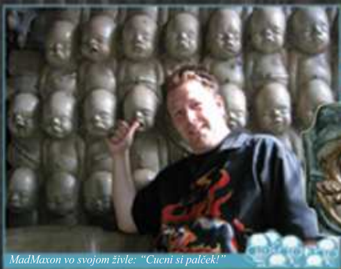
MadMaxon vo svojom živle: "Cucni si palček!"