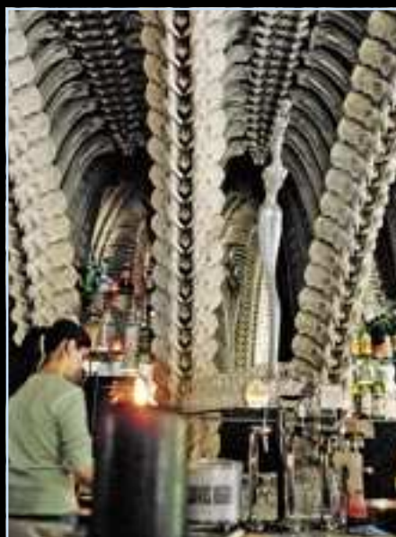
Bar s replikou stojanu na mikrofón.

Narodil som sa v roku 1940 a vtedy nebolo