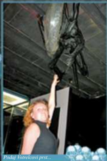
Podaj Votrelcovi prst...