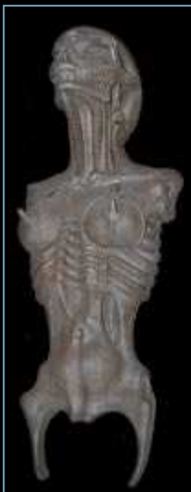
H. R. Giger: Biomechanoid.

Viete, vo Švajčiarsku nemá fantastické umenie žiadnu tradíciu. To znamená, že tu nie sú múzeá, ktoré by vystavovali fantastické umenie, alebo surrealistov. V Kunsthaus v Zürichu je niekoľko obrazov od Daliho, či Maxa Ernsta, jeden obraz tam mám aj ja. V takejto situácii bývalý vystavovateľ a riaditeľ zámku St. Germain v Gruyères chcel zaviesť tradíciu fantastického umenia, s centrom práve na tomto zámku. Ponúkol mi výstavu pri príležitosti mojich päťdesiatych narodenín. Výstava bola veľmi úspešná, trvala sedem mesiacov a navštívilo ju okolo štyridsať tisíc ľudí. To nám potvrdilo, že o toto umenie je záujem. Po výstave som sa dozvedel, že dolný zámok St. Germain pôjde do dražby. Odporučali mi, aby som sa oň zaujímal, že určite niekoho nájdem, kto to finančne potiahne. Našiel som, no desať dní pred aukciou mi pán, ktorý to mal zaplatiť povedal, nech to skúsim sám a... vyparil sa. Tak som predal všetky svoje obrazy čo som mal, požičal si peniaze a zámok som kúpil. V roku 1998 sme začali robiť výstavu, najprv mojich vecí v dolnej časti, neskôr aj iných umelcov – teraz tu má výstavu môj priateľ Dr. prof. Ernst Fuchs. Odtvtedy, čo mám tento zámok, už viem, kam idú všet-