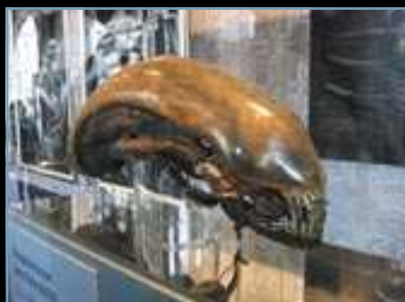
Výstava vo výklade obchodného domu v Berne.

Práve teraz je v jednom veľkom obchodnom dome v Berne veľká výstava, ktorá vznikla na podnet jedného veľmi oceňovaného vystavovateľa. Ten takto predstavil celú bernskú umeleckú scénu a ja tam mám okrem výstavy aj tridsaťšesť metrov štvorcových priestoru vo výklade obchodného domu. Vyzerá to veľmi dobre. Ak náhodou