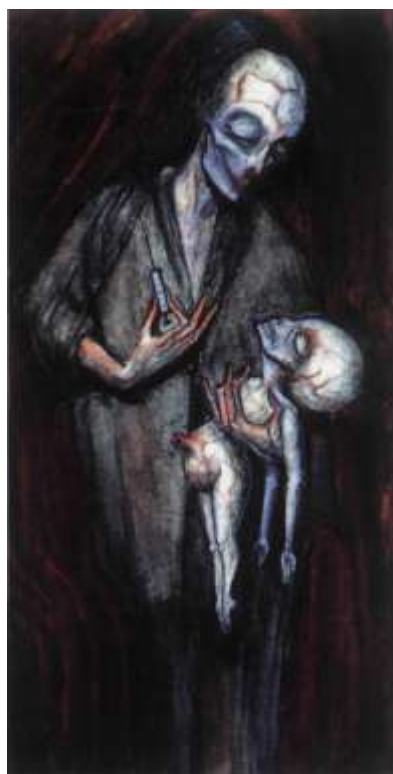
Mother and child, 1962.

strugati vodenu boju s papira. Nakon toga sam pokušao raditi u ulju, ali se nikada nisam usavršio, jer mi se život činio prekratkim da sve svoje ideje uspijem uhvatiti u ulju.