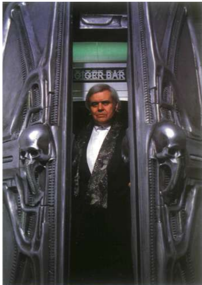
H.R.G. in the entrance of the Giger-bar, Chur, 1992.