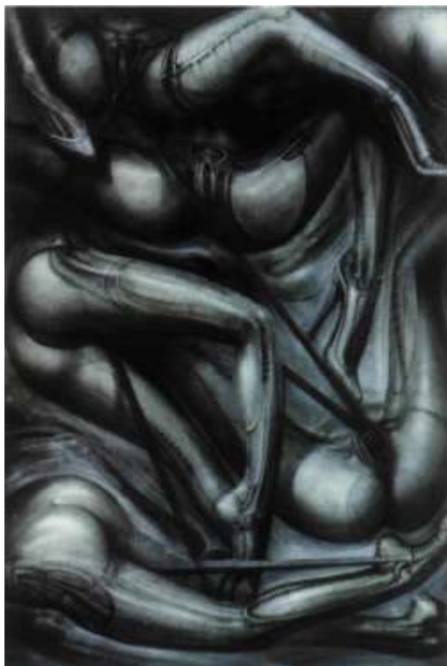
The Net I, 1988.

"Toaleti su mi mirisali po zabranjenom seksu i redovito sam ih sanjao."