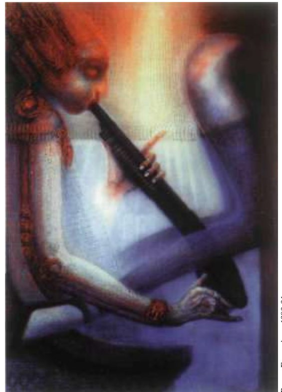
Pump Excursion, 1989-91.

"Na početku sam crtao uistinu grozno i da je netko pokušao predvidjeti budućnost iz tih listova, sigurno bi ustvrdio da ću biti farmaceut, a ne slikar."