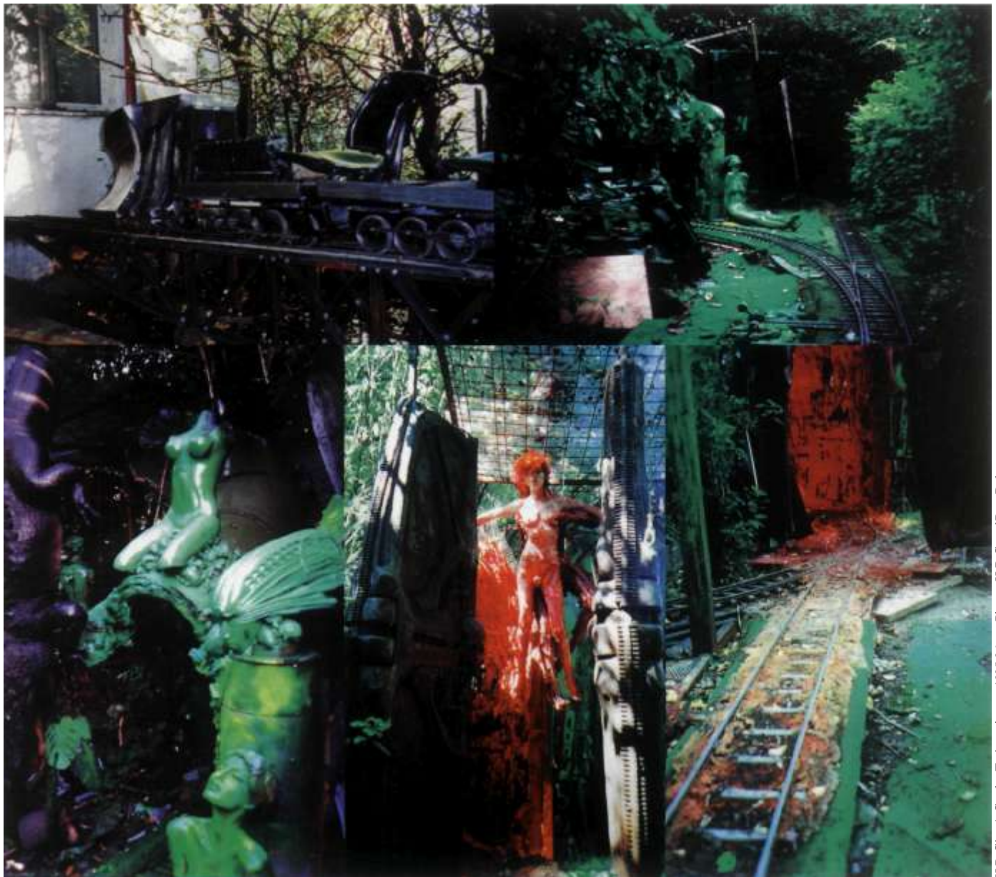
H.R.Giger's Garden Trainproject, 1995-96 • Photos: H.R.G. and Reto Dohner