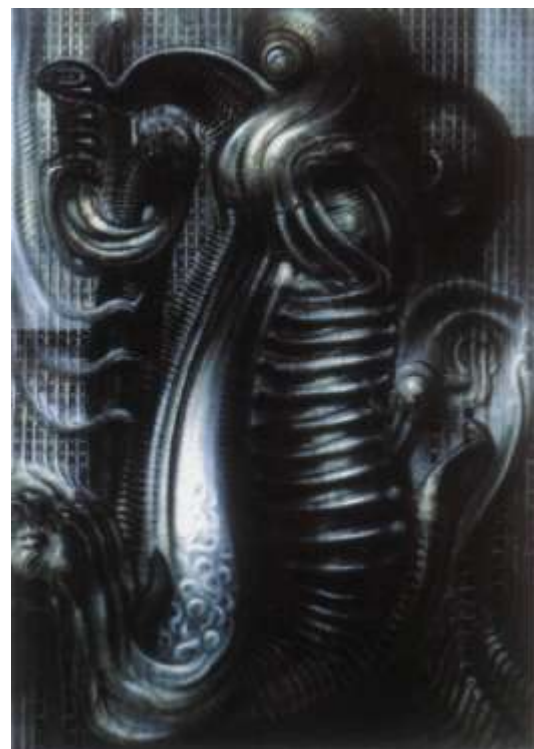
New York City V (Embryo Growth), 1980.

"Toaleti su mi mirisali po zabranjenom seksu i redovito sam ih sanjao."