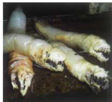
Killer Condoms models by H.R.Giger, 1996.

"Bio sam prilično sramežljiv prije nego sam ušao u pubertet, a zapravo i nakon toga, s obzirom da sam prvi put spavao s djevojkom kada sam imao 21 godinu."