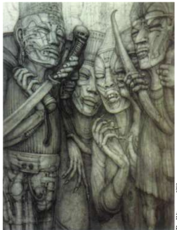
The Witnesses, 1988.