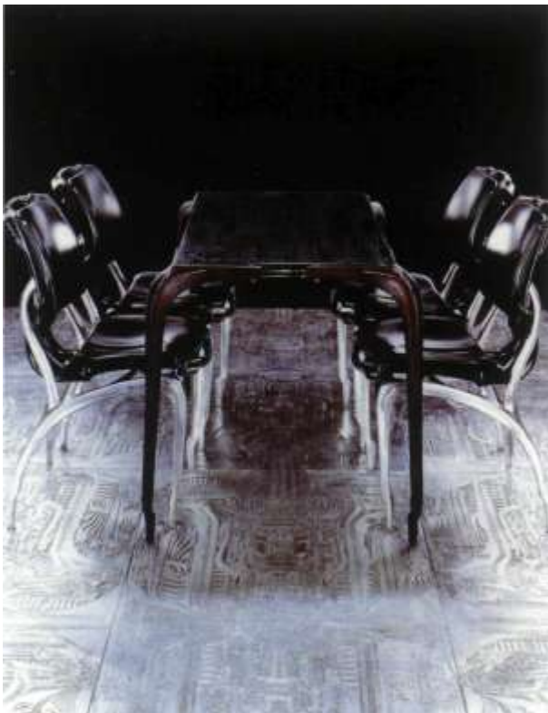
Interior Decoration, 1991, Table and chairs