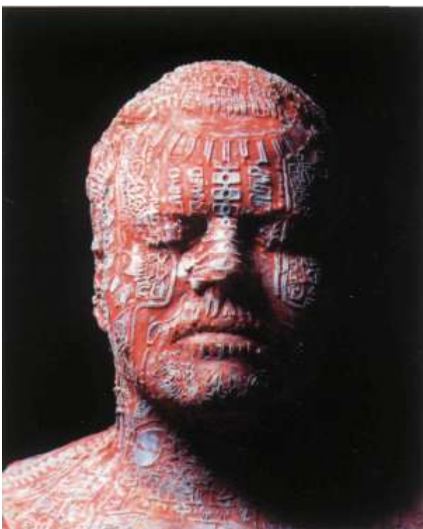
Mask II, 1993.

"Nekada su me sputavale čistačice i nedostatak sredstava, ali više ne obraćam pozornost na takve stvari."