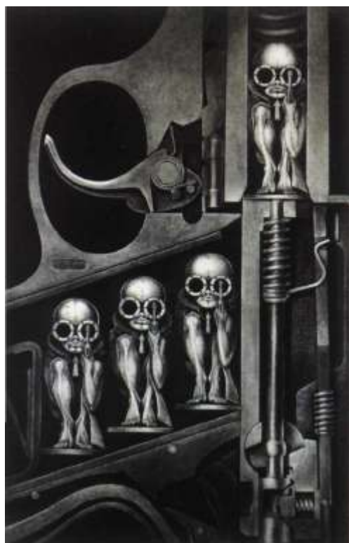
Birth Machine, 1967.