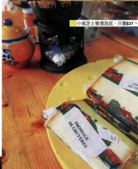
小塊芝士售價超抵，只售$37

正午，急不及待跑到建在傳統山中木屋外的Restaurant le Chalet，曾在法國試吃過芝士火鍋的攝影師皺着眉頭說：「芝士火鍋味道古怪，吃不慣。」在「法國」芝士火鍋的陰影下，我們轉試烤芝士 (Raclette)，芝士以電爐來烤，用刀把溶化了的芝士削下並放在碟中，同樣配以薯仔、麵包甚至風乾的牛肉來吃，味道怎樣呢？我的瑞士芝士初體驗在滿足與美味的情況下完滿結束，攝影師的「垃圾味」芝士也可以換上又香又濃的美味回憶了。 Restaurant Le Chalet 地址：CH-1663, Gruyères 電話：41-26-921 2154 營業時間：11am-12mn 交通：乘火車至Montbovon，再轉車到Gruyères站，步行15分鐘才到達Gruyères小鎮。