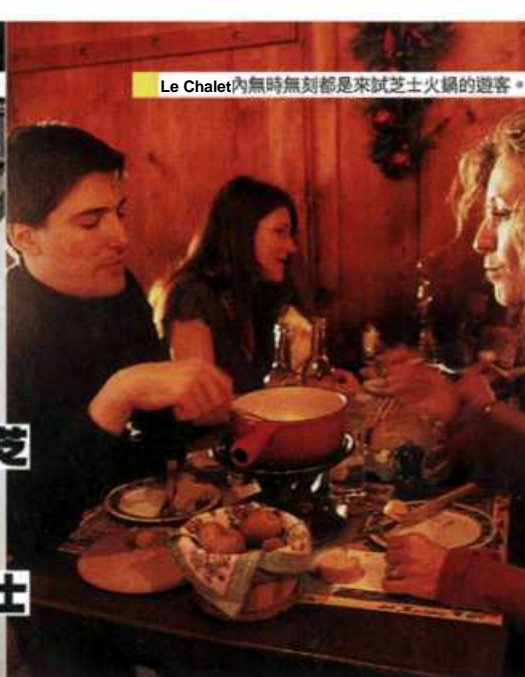
Le Chalet內無時無刻都是來試芝士火鍋的遊客。