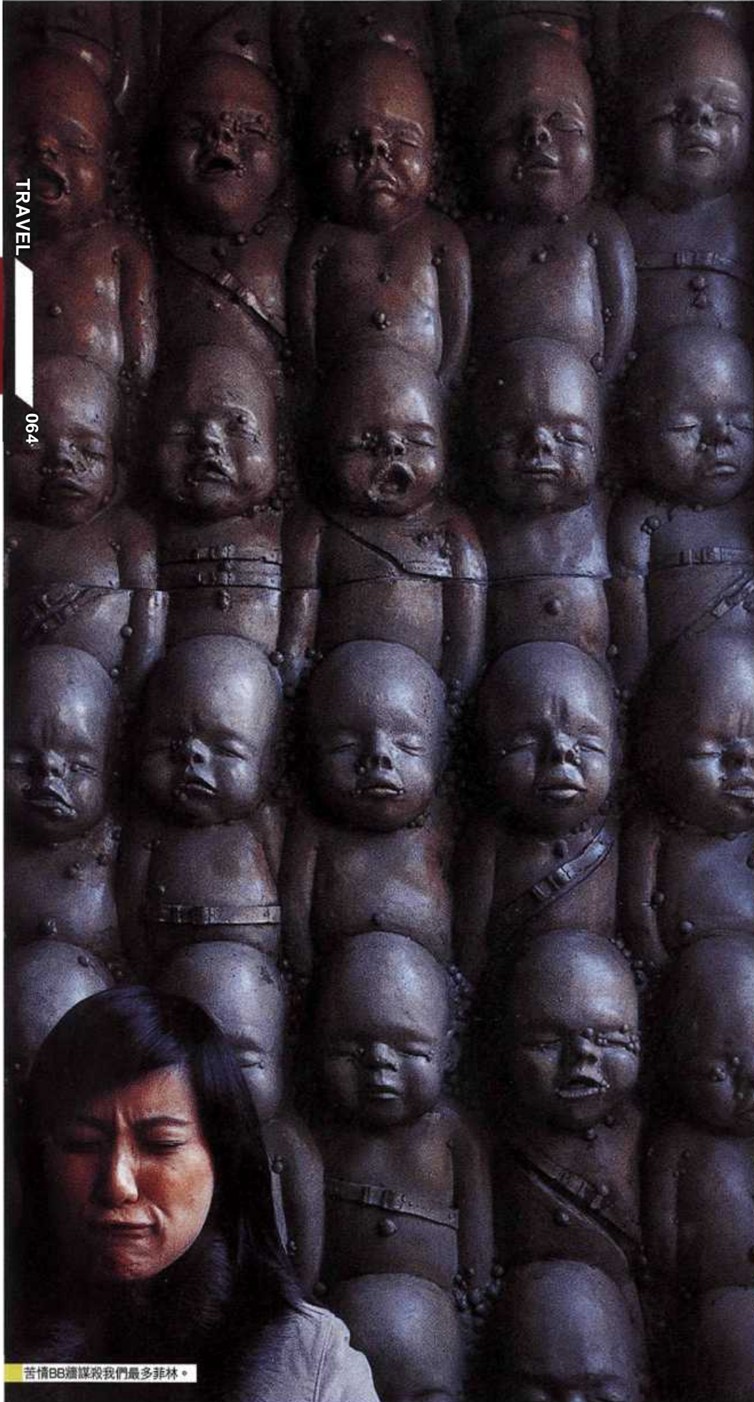
苦情BB牆謀殺我們最多菲林。