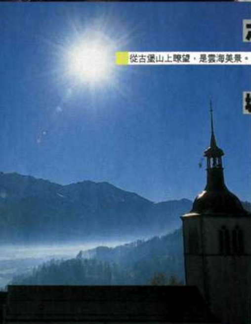
從古堡山上瞭望，是雲海美景。

芝士之城 「記得食多些芝士火鍋 (Fondue) 呀！」編輯大頭臨走前「叮囑」着。我，非常聽話，要吃，還要到瑞士最出名出產芝士的阿爾卑斯山小城Gruyères吃。 這個小山城小得一天就走得完，一早來就可以「霸佔」整個古城。踏在印證着歲月流逝、磨平磨滑的大石板路上，鼻子跟着芝士的香氣走，芝士店五步一間，不理剛吃飽早餐，也手快快一口又一口地試食起來。「這個很淡！像卡夫芝士。」「這個又濃又香！」我們七嘴八舌地討論着的同時，也嚷着買這種買那種了。「挾持」回家的還有現成的芝士火鍋底、火鍋爐和許多奶類製餅乾。