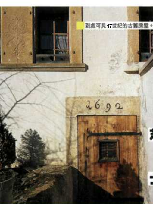
到處可見17世紀的古舊房屋。