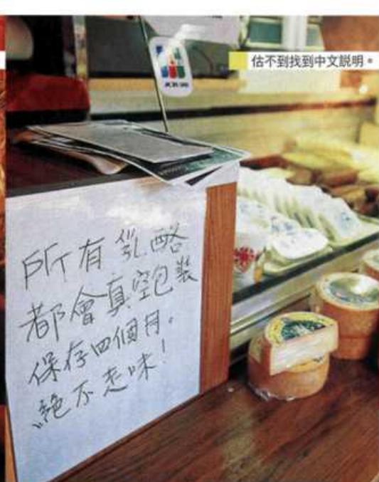
估不到找到中文說明。