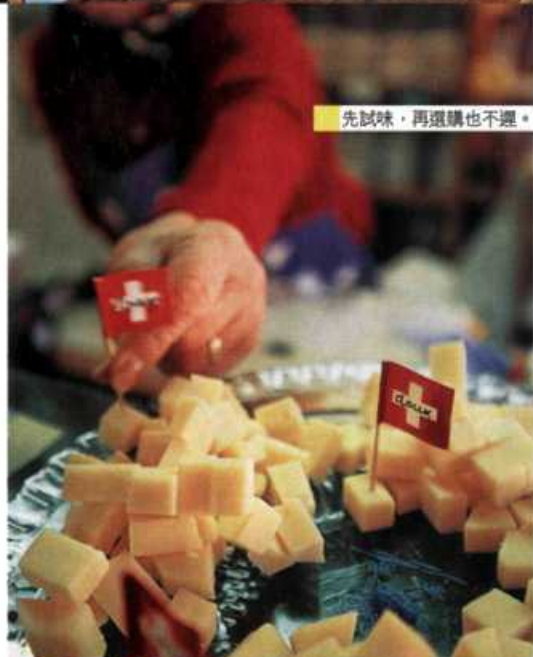
先試味，再選購也不遲。

芝士之城 「記得食多些芝士火鍋 (Fondue) 呀！」編輯大頭臨走前「叮囑」着。我，非常聽話，要吃，還要到瑞士最出名出產芝士的阿爾卑斯山小城Gruyères吃。 這個小山城小得一天就走得完，一早來就可以「霸佔」整個古城。踏在印證着歲月流逝、磨平磨滑的大石板路上，鼻子跟着芝士的香氣走，芝士店五步一間，不理剛吃飽早餐，也手快快一口又一口地試食起來。「這個很淡！像卡夫芝士。」「這個又濃又香！」我們七嘴八舌地討論着的同時，也嚷着買這種買那種了。「挾持」回家的還有現成的芝士火鍋底、火鍋爐和許多奶類製餅乾。