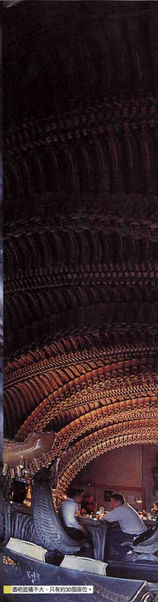
酒吧面積不大，只有約30個座位。