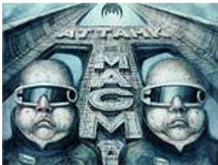
"Attahk", Cover for Magma, 1978

Als Möbeldesigner wurde Giger vor allem durch den für den Film "Dune - Der Wüstenplanet" entworfenen Harkonnen-Stuhl bekannt, der im Kunsthaus zu sehen ist. Auch ein Mikrofonständer für Jonathan Davis von "Korn" findet sich unter Gigers Werken.