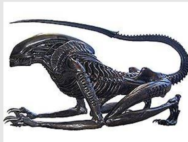
Necronom - Alien Monster III

Als Filmdesigner gestaltete Giger unter anderem auch Modelle für die Filme "Dune", "Poltergeist II", "Alien III" und "Species".