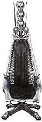
Harkonnen-Stuhl für den Film "Dune - Der Wüstenplanet"