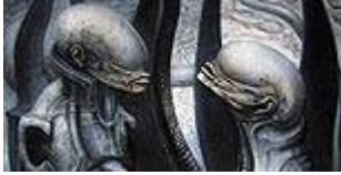
Alien und Mutanten