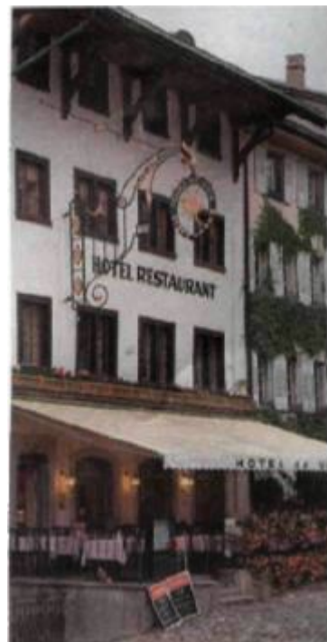
Restaurant/Hotel de Ville, 1663 Greyerz Tel: 0369212424

«Weil das Rindfleisch-Filet mit Morcheln exquisit ist», schwärmt H.R. Giger. Das sei der Grund, weshalb er des Öfteren im Restaurant de Ville einkehre. Auf der Speisekarte stehen aber auch Greyerzer Spezialitäten wie Fondue, Raclette und kamingeräucherter Bauernschinken. Das Restaurant ist rustikal eingerichtet. Und von der Gaststube gemessen die Besucher eine atemberaubende Aussicht auf das Freiburgerland.