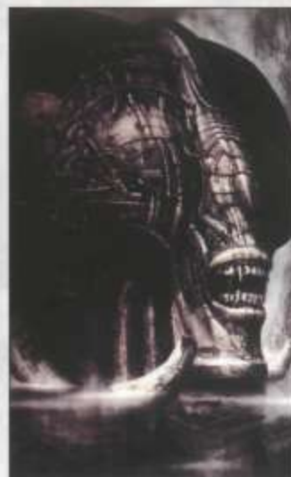
Necronomicon IIIa, 1976 - 100 x 70, Acrylique sur papier/bois, ©HR Giger Exposition Biomechanoïdes Paris 2004 (Galeris Arludik)