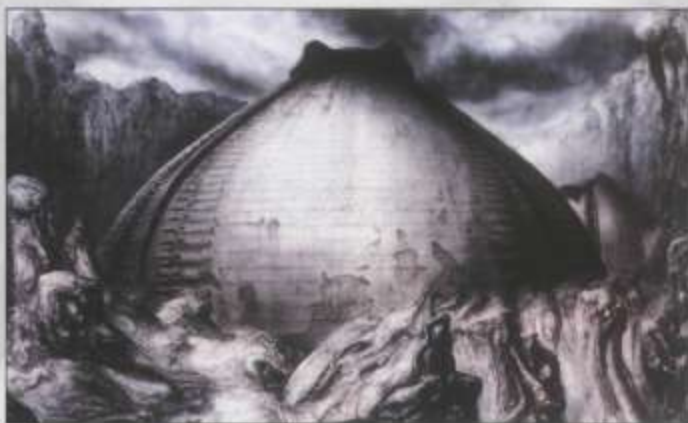
Silo à œufs extérieur, 1978 - 100 x 140, Acrylique sur papier, coll. Musée HR Giger - Exposition Le Monde selon HR Giger (Musée de la Halle Saint-Pierre)