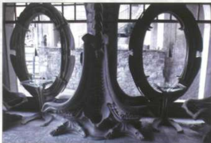
Giger Bar - Gruyères (Suisse)

Oui, cette fois-ci il est exactement tel que je le voulais. Le premier Giger Bar, qui a été construit à Tokyo sans ma participation active, était une véritable horreur, en grande partie à cause d'insurmontables problèmes de communication. Suite à un malentendu, après que je leur aie livré les plans du bar, ils ont commencé à en fabriquer les éléments et à construire le bar, à partir de simples esquisses, sans réaliser que j'étais moi-même en train de sculpter et de fabriquer tous ces éléments dans mon atelier