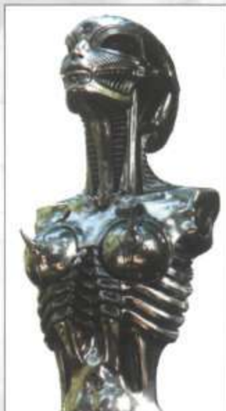
Biomech, 2002 - Sculpture, ©HR Giger Exposition Biomechanoïdes Paris 2004 (Galeris Arludik)