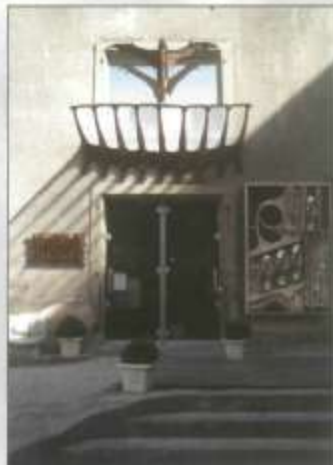
Museum HR Giger Gruyères (Suisse)