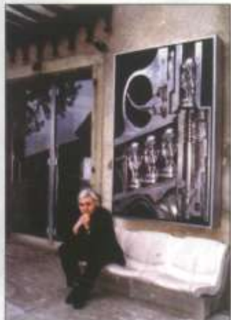
HR Giger devant son musée Gruyères (Suisse)