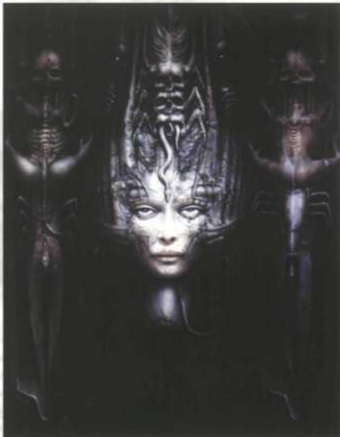
Li II, 1974 - 200 x 140, Acrylique sur papier/bois, ©HR Giger Exposition Biomechanoïdes Paris 2004 (Galeris Arludik)

d'apprendre l'existence de ce nouveau film de la saga Alien par des amis travaillant dans le milieu du cinéma, alors que la production du film était déjà bien avancée. De ce que j'ai pu lire du scénario, je ne pense pas que cela m'aurait particulièrement intéressé de travailler dessus, mais cela aurait tout de même été sympathique de me le demander. Travailler sur un film est un processus long et très prenant, et je ne suis pas prêt à renouveler l'expérience à moins qu'une idée forte s'empare réellement de mon imagination. Dans mon esprit, la saga d'Alien a encore une chose à faire, revenir à son point de départ, pour fournir à ses spectateurs zélés quelques dernières surprises et une part de réponses. Je suis sûr que tous ceux qui ont été impliqués au départ dans la création de cette série sentent également cela, et que, lorsque le bon script arrivera, tous seront prêts à refaire le voyage une fois encore.