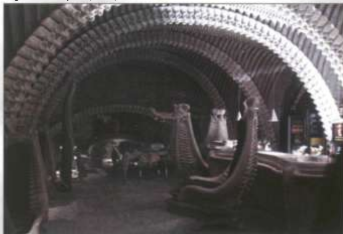
Giger Bar - Gruyères (Suisse)