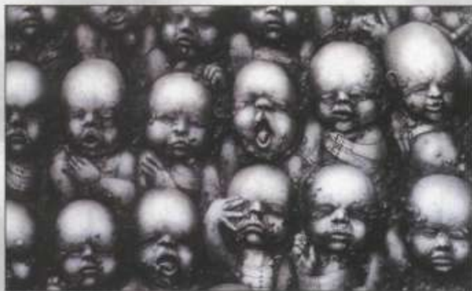
Paysage XVIII, 1973 - 70 x 210, Acrylique sur papier, coll. Musée HR Giger - Exposition Le Monde selon HR Giger (Musée de la Halle Saint-Pierre)