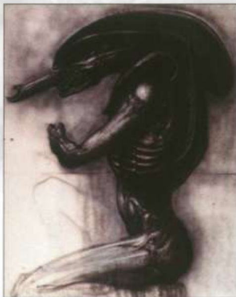
Alien - ©HR Giger Exposition Le Monde selon HR Giger (Musée de la Halle Saint-Pierre)