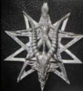
В момента най-модерна сред феновете е катарамата за колан

"Харесвах Деби, но не и музиката и. Реших, че и трябва нещо различно. По това време един приятел се занимаваше с акупунктура и аз бях толкова впечатлен от заниманието му, че реших да набода главата на Деби с игли."