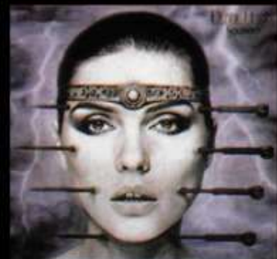
"Харесвах Деби, не и музиката ѝ"

Огромните рисунки на същества като излезли от киберроман му печелят бърза популярност. През 1966 Гигер прави първата си самостоятелна изложба. Започва период на бурна творческа активност, по време на който се появяват скулптури като "Машина за раждане" и няколко малки пейзажа, съчетали технологични и органични елементи. През 1968 създава първите извънземни в живота си за научнофантастичния филм Swisstrade - куче, облечено в пластмасов калъп, и хуманоид с вградени в главата и торса камера и записващо устройство. Голямата слава идва на следващата година с Biomechanoids 1969 - първата книга с репродукции на Гигер. Алтернативният свят се сблъсква челно с еротизма на биомеханиката му и го обиква завинаги.