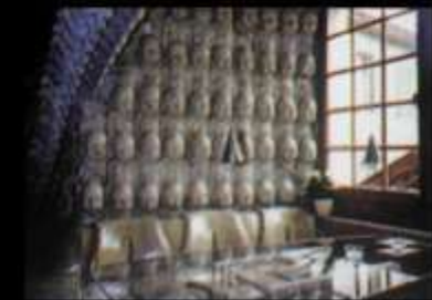
Интериорът на "Бар Гигер" в Чур, Швейцария