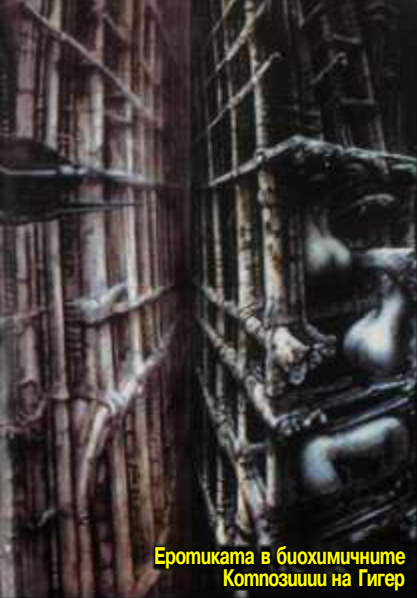
Еротиката в биохимичните Композиции на Гигер