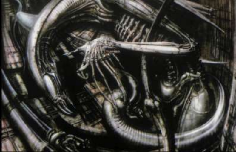
Създанието от "Некрономикон", вдъхновило Ридли Скот и послужило за прототип на Пришълеца