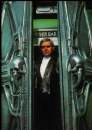
Гигер пред вратите на бара в Ню Йорк

Всеки, видял биомеханичните му творения - смразяващи комбинации на човешка плът и технологични елементи или извънземния Пришълец, герой на 5 филма, потръпва. Разглеждането на албум с произведения на Х. Р. Гигер е предизвикателство и за най-устойчивата психика. Но картините му се купуват, ал-