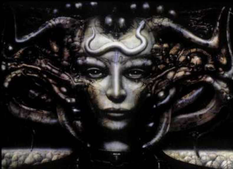
Биомеханичните му жени са странно привлекателни

Киното се разминава с революцията на Гигер, но само за малко. През есента на 1977 художникът публикува своя поглед върху "Некрономикон", легендарната окултна книга на мъртвите. Илюстрациите в нея са невероятни - ужасяващи създавания със странен чар. Едно от изданията попада в ръцете на режисьора Ридли Скот, които тъкмо е подписал договор за филм. Творбата е за катастрофирал на чужда планета кораб, посрещнат от неприятни домакини - свръхагресивна раса извънземни. "Точно този ни трябваше, за да измисли чудовищата и планета-