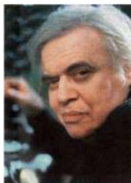
Alien-Schöpfer und Oscar-Gewinner: H. R. Giger.

FÜR LAPPISCHE 1000 DOLLAR Vorauszahlung machte sich der Schweizer Künstler H. R. Giger (64) im Sommer 1977 an die ersten Entwürfe eines Ungeheuers und seines Ambientes, «die den Look von Science-Fiction-Filmen veränderten» wie die Fachzeitschrift «Cinefantastique» schrieb. Das Faszinierende an Gigers biomechanoider Schöpfung ist, dass das garstige Vieh ein echter, lebender Organismus zu sein scheint, der über einen Entwicklungszyklus verfügt. Da stapft nicht wie bei «King Kong» oder «Predator» (siehe Box unten links) ein simples Biest durch die Gegend und macht alles platt. Bei «Alien» entspringt insektenartig zu Beginn eine Larve einem Ei und