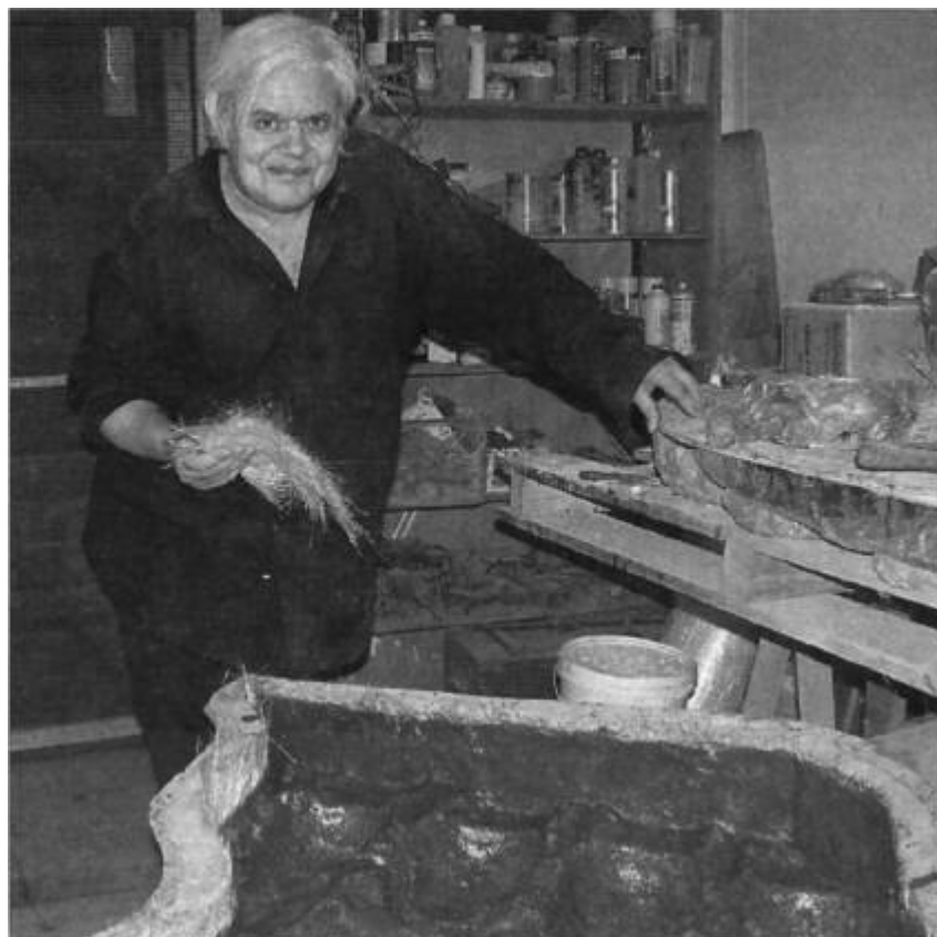
Polyester als Grundlage seiner seriell hergestellten Babyköpfe: H. R. Giger in seinem Atelier in Seebach.

Wie reagieren die Menschen, wenn Sie Ihr Museum oder Ihre Bars betreten?